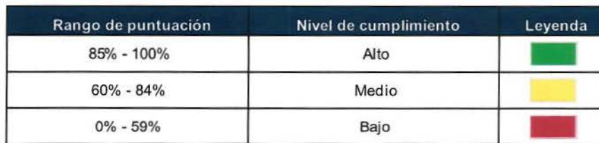
Tabla 1: Rango de semaforización

Un valor de N/A en 'Metas Programadas' indica que no hubo planificación para ese producto en el trimestre correspondiente.